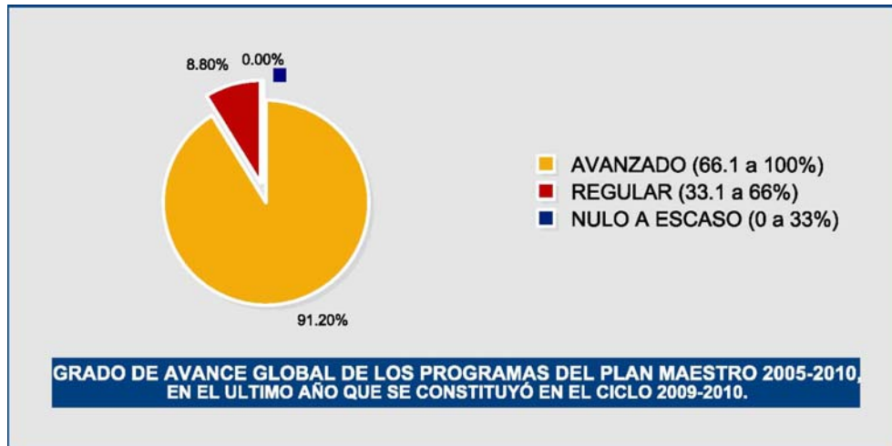
Gráfica No. 5.1

En la siguiente Gráfica no. 5.2 al clasificar los 35 programas por meta institucional, tenemos que en 11 de las 12 metas planteadas en el Plan Maestro, se logró un avance igual o superior al 80%, aspecto que resalta como una fortaleza.