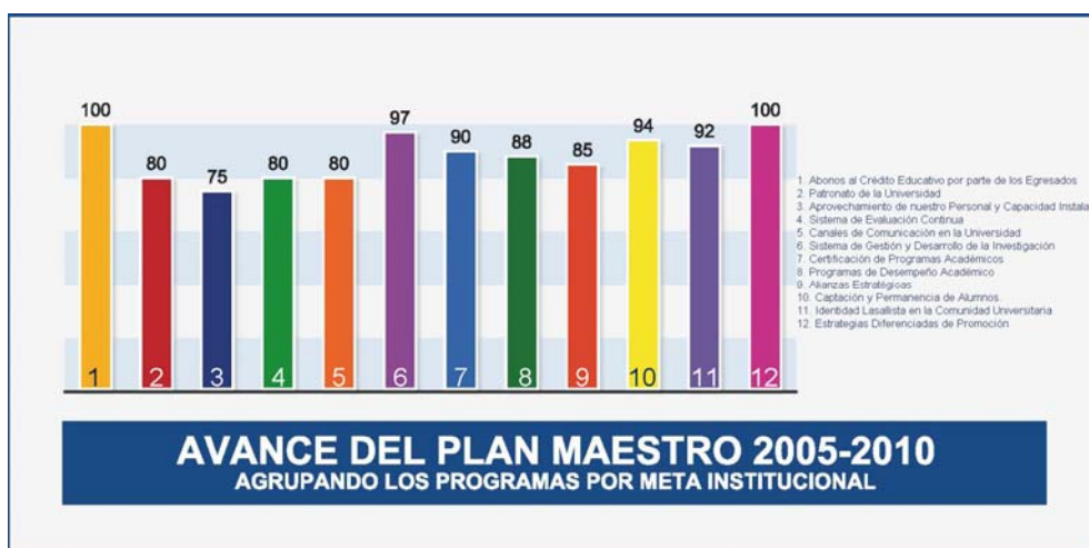
Gráfica No. 5.2

En la siguiente Gráfica no. 5.2 al clasificar los 35 programas por meta institucional, tenemos que en 11 de las 12 metas planteadas en el Plan Maestro, se logró un avance igual o superior al 80%, aspecto que resalta como una fortaleza.